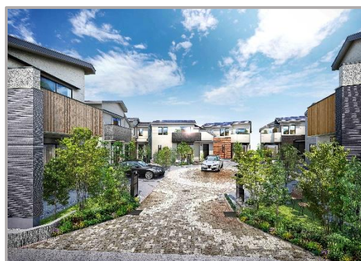
【無電柱化したまち並みイメージ】