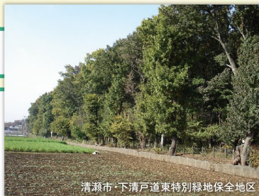
清瀬市・下清戸道東特別緑地保全地区

緑地の有する機能の維持増進を図るために行う立木竹の皆伐または択伐、土地の掘削その他必要な措置