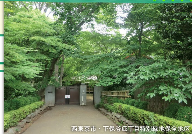
西東京市・下保谷四丁目特別緑地保全地区