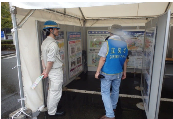
公社職員によるパネル説明