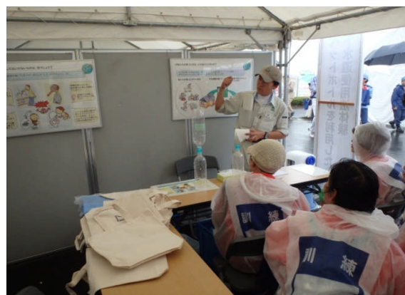
ペットボトルによる実験