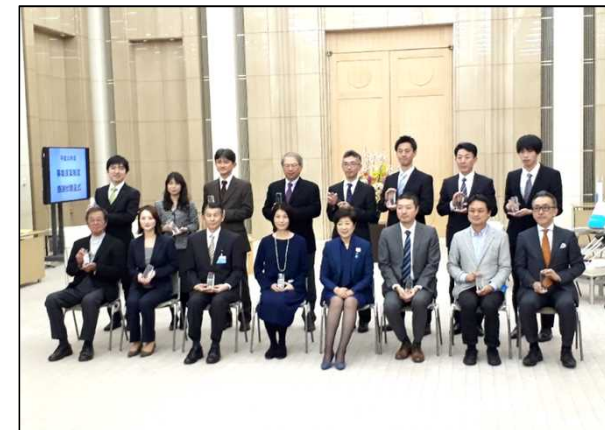
感謝状表彰者記念撮影