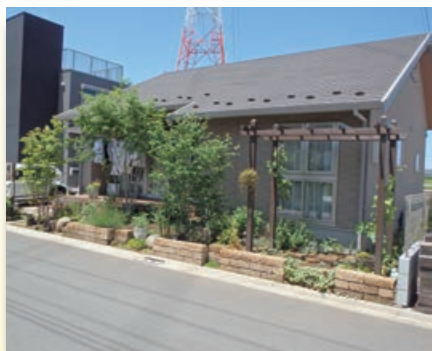
東町土地区画整理事業地区施工（日野市）