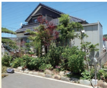
宇津木土地区画整理事業地区施工（八王子市）